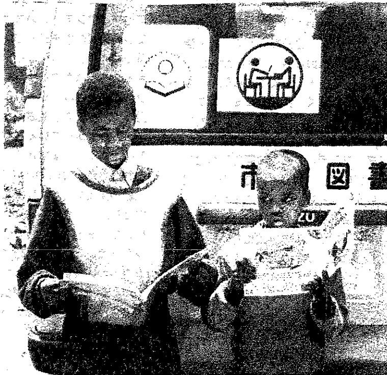
本を読む生徒 ダーバン北西オチマチ小学校