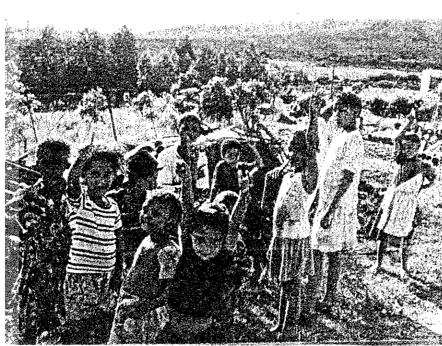
セレスの農園労働者の子供達。 学校へ行っていない。 「学校へ行きたい人？」 みんな手を上げる。