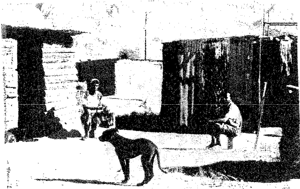
農園で働く期間は3ヵ月。あとは失業状態。ケークンがセレスに

次に訪れたマシヤ高校でもすばらしい合唱団が私たちをもてなしてくれた。この合唱団は地域でも有名で、この学校を訪れ彼らの力強い歌