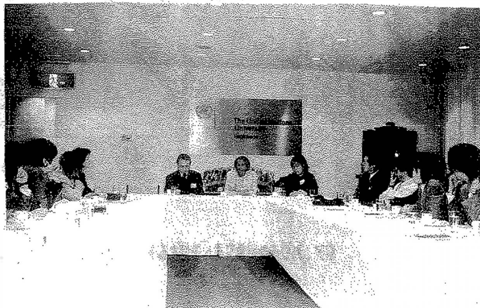
ムベキ副大統領夫人とNGOとのミーティング …………… 国連大学にて

◆ムベキ副大統領は来年の総選挙後マンデラ氏の後を継いで大統領に就任が確実視されている。