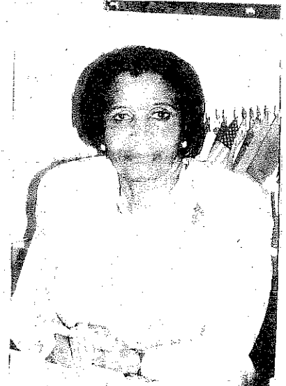
来日中のムベキ副大統領夫人