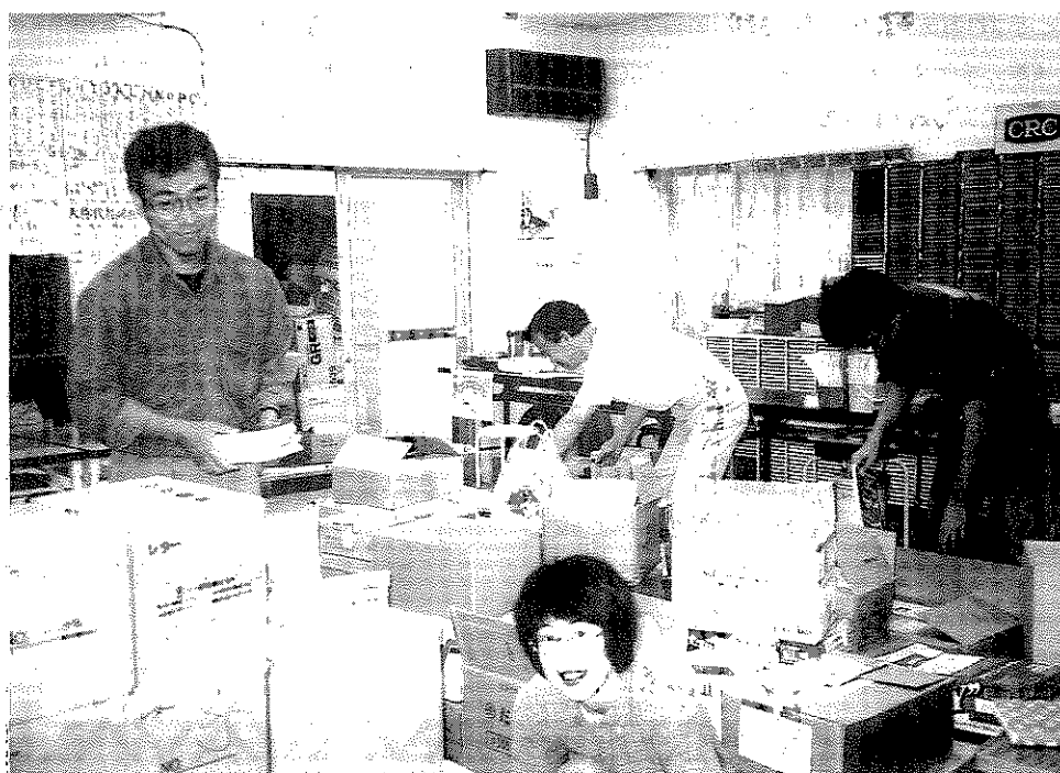
ある日の梱包作業風景（埼玉県与野市） 2000.11