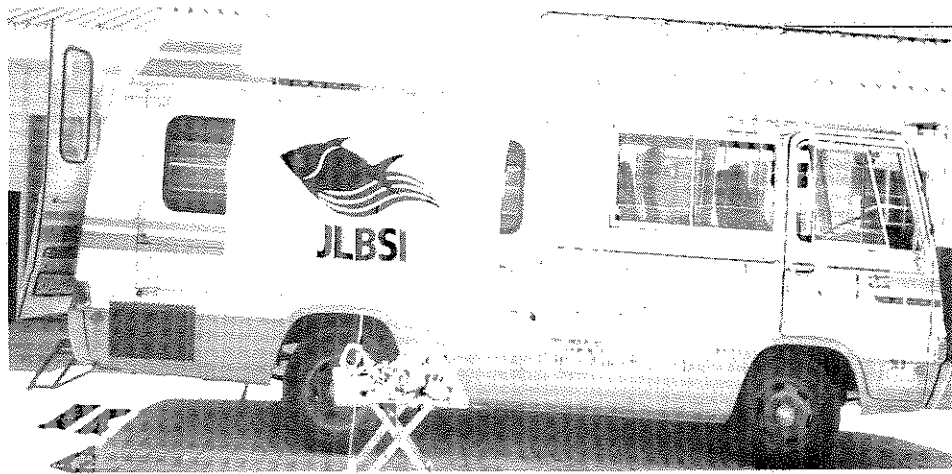
上/魚類博物館の出張展示に使われる 中古移動図書館車

教育学部ではバスに載せる教材を集めています。子供たちには地元の魚を通して自然環境やその保護の大切さ教えていきますが、それに必要な教材は全て揃えたいと思っています。バスの巡回ルートにはグラハムスタウンの恵まれない学校地域が含まれます。今年の第2 四半期までには45校を廻る予定です。将来的には巡回ルートを東ケープ州全域に広げていきたいと思っています。今年1999年の4月にはスタートする予定です。また近々、進捗状況をお伝えいたします。 (訳/久我祐子)