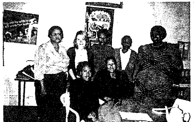
大きな大きな先生たちと

参加している各地域からの先生方がこの日集まってくださいました。ワークショップはSLOT (SCHOOL LIBRARY OUTREACH PROGRAMME 学校図書室推進プログラム) というもので、年10回開催されます。7名のFACILITATOR (ワークショップの先生) ももちろん学校の先生方で、自分たちの仕事も忙しい中、ボランティアで教えています。今回ミーティングに参加してくれた大きな大きな先生は、100キロ南の海沿いの町ポート・シェブトンからわざわざ駆けつけてくれて、彼女の学校での図書室活動の様子を報告してくれました。今回は、彼女の学校をぜひ訪問したいと思っています。参加者6名のうち、ダーバン市内からは一人だけインド系の先生が参加したのみで、あとは皆地方の小さな村の学校の先生方でした。どの学校も図書室はなかったのですが、ELETのワークショップで学んだあとに始めたプロジェクトによって、子供たちが本に親しむようになったと成果を報告しています。またTAAAから届く本はとても役立っていると感謝の言葉を皆からもらいました。やはり現状としては、地方に行くほど設備や資源が乏しく、図書室のない学校が多い。そんな学校では、教室の片隅にコーナー・ライブラリーを作ったり、コンテナを寄付してもらい図書室にしたりしています。また、子供たちに自分で本を作らせるプロジェクトはなかなか面白い。中には驚くほどの才能を発揮し、興味深い物語を書く子もいるそうです。本を使って“リサーチ”させるプロジェクトをしている学校もあります。TAAAから送られてくる本で、童話や小説、参考書などが特に役立っており、小学生に難しいものは、成人識字教育センターなどでも活用されているそうです。希望としては、1、2年生用の絵本の類がもっとあるとうれしいとのこと。また、少しずつ本が増えてきても棚がなくて積み上げており、なんとか本棚を購入したいが資金が足りないという声が多くあがっていました。