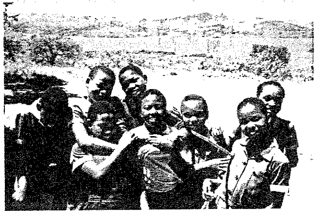
カニサニ小学校（ヒルクレスト）の子どもたち