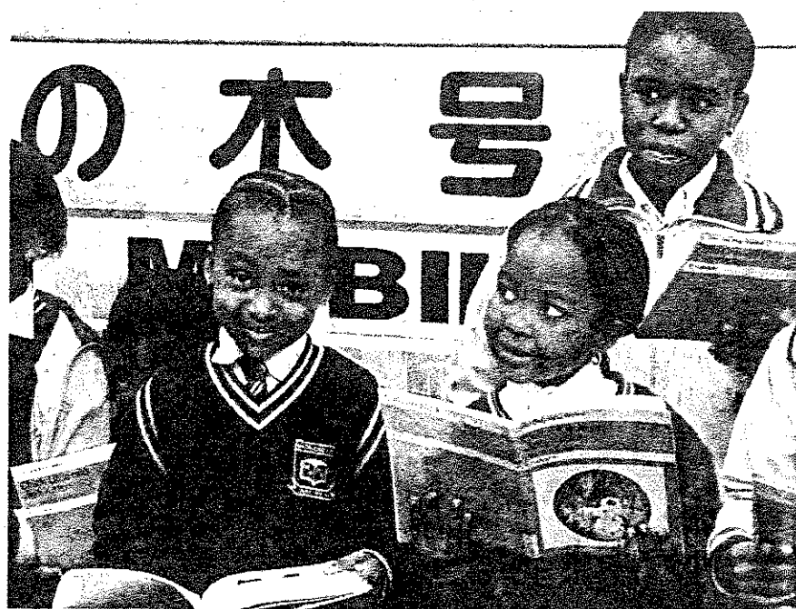
デベトンの小学校で