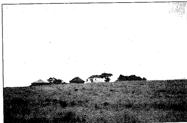
ダーバンよりフルンディヤ

クワズールーとはズールー人の住むところという意味。海あり山ありの美しい州で、個人的には南アフリカで私が最も好きな地域です。ズールーとは天国という意味で、彼らの住む地域が美しい天国のようだという事と、彼ら自身が優れた民族であるという意味を持っています。かつてズールー人の戦士たちは無敵で、南部アフリカ地域で最も豊かな土地を支配していました。ヨーロッパ人たちが上陸しても、その強さと誇りの高さにてこずったようです。当時、最新の武器を備えたイギリス軍を一度は破ったほどです。そこでヨーロッパ人がしたことは、読み書きをしない彼らに自分たちに都合のいい契約書を作ってサインをさせるという汚いやり方でした。その後アパルトヘイトが始まると、黒人内の分裂をもくろみ、ズールー人だけを優遇するというやり方をとりました。他の大陸や国々でも同じようなことがあったと思いますが、南アフリカはヨーロッパ人たちにめっちゃくちゃにされました。イギリス人がこの地にどんどん入植し、さとうきびの大プランテーションを作り始めたのですが、労働力にズールー人を使おうとしても、プライドが高い彼らは「畑なんかで働けるか」と言って全く使い物になりません。そこでインドから多くの労働力が導入されました。その際、すでに日本からインドに入っていた人力車が「リクシャ」という名で持ち込まれました。現在は観光地でズールーの男性たちがひいています。ズールーの社会は封建的で、かつては、王様の下に各地のチーフがおり、それぞれの地域を統括していました。経済的に豊かな男性は、ロボラと呼ばれる、牛11頭を支えれば何人でも奥さんをもらうことができました。現在は経済、社会システムが変わっているにもかかわらず、相変わらず”俺は男だ”的な男性が多いように思います。ズールー人は踊りや音楽などに秀でており、伝統的な儀式の際には素晴らしい歌と踊りを披露します。舞台と映画にもなった『サラフィナ』の制作者、出演者はほとんどズールー人です。女性たちのビーズ細